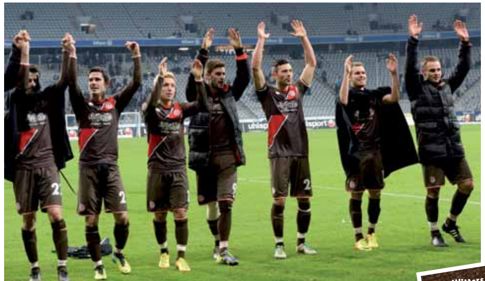
Löwen-Bezwinger! Nach dem zweiten Auswärtssieg in Folge hatten die Kiezkicker allen Grund zur Freude.

Was herrschte beim KSC doch für eine Tristesse im Mai 2012! Zwar hatte der neue Cheftrainer Markus Kauczinski seine Mannschaft in der Defensive stabilisieren können und diese in den letzten sieben Saisonspielen auf den Relegationsplatz gehievt, doch die Badener kassierten im entscheidenden Moment dieses eine Gegentor zu viel: Die Karlsruher kamen beim Relegationsrückspiel im heimischen Wildpark gegen den SSV Jahn Regensburg nicht über ein 2:2 hinaus und stiegen damit aufgrund der Auswärtstorregel ab. Mit einer runderneuertem Mannschaft – unter den Neuzugängen befand sich unter anderem Ex-Kiezkicker Rouwen Hennings – gelang dem KSC nach einem kleinen Holperstart schließlich als Drittligameister souverän der direkte Wiederaufstieg. 79 Punkte standen am Ende zu Buche, bei einem Torverhältnis von 69:27. Herausragender Spieler war dabei Hakan Calhanoglu, der 17 Tore und 11 Assists zu diesem Erfolg der Badener beisteuerte – eine gute Quote für einen 19-Jährigen. Allerdings gehörte das Karlsruher Eigen gewächs schon dem Hamburger SV, so dass der Mittelfeldspieler seit dieser Saison seine Fußballschuhe nicht mehr für den Aufsteiger, sondern für die Rothosen schnürt. Und weil auch Sportchef Oliver Kreuzer in der Sommerpause relativ überraschend an die Elbe wechselte, fragte man sich im Wildpark, welche Rolle das Team mit